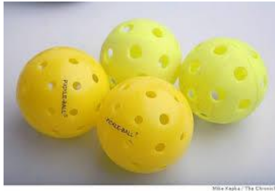
Figure 2-2. La Balle.

Les balles de droite sur la photo de la figure 2-2 sont habituellement utilisées pour le jeu à l'intérieur et les balles de gauche sur la photo sont habituellement utilisées pour le jeu à l'extérieur. Cependant, toutes les balles qui sont approuvées, sont acceptées pour jouer tant à l'intérieur qu'à l'extérieur. La liste complète des balles agréées est sur le site de l'IFP.